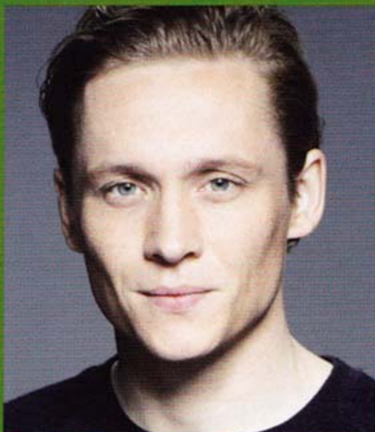
Matthias Schweighöfer Idee